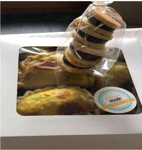
1ro. y 2do. Premio